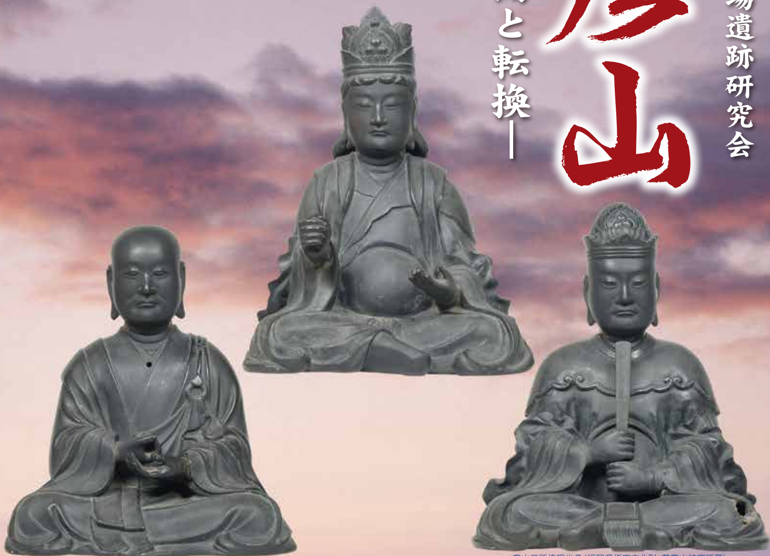
彦山三所権現坐像(福岡県指定文化財・英彦山神宮所蔵)